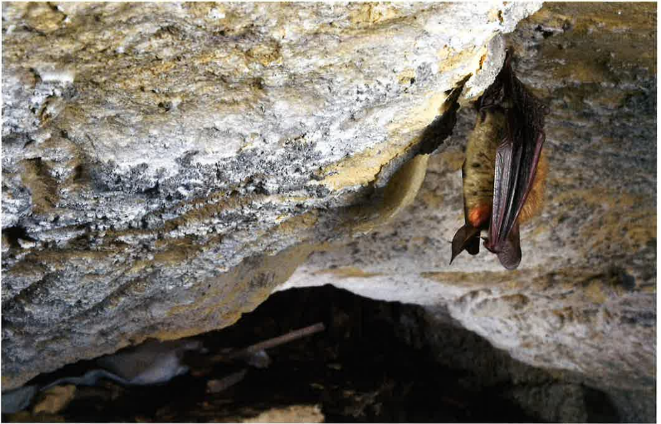
Zelden hangen Bechsteins vleermuizen vrij. De meeste dieren blijken diep weggekropen te zitten.

kruidlaag en bospoeltjes lijkt belangrijk te zijn (Kanuch et al. 2008). Bechsteins vleermuizen zijn over de jaren heen trouw aan hun jachtgebieden en zijn dus gevoelig aan veranderingen in hun leefomgeving. De prooien, voornamelijk vliegen, vlin-ders, kevers en spinnen, worden van de vegetatie en de bodem “geplukt”. De sonar is zacht en reikt slechts enkele meters ver (Siemers en Swift, 2006). Met haar grote oren kan de soort ook passief luisteren en zo naar prooien zoeken. Het klassieke vleermuisonderzoek met een batdetector is hierdoor niet geschikt om de soort te inventariseren.