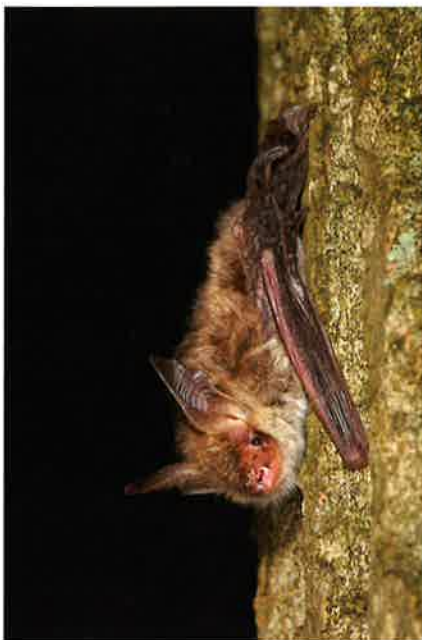
Bechsteins vleermuis.