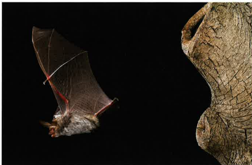
Bechsteins vleermuis.

Het vangen van vleermuizen in de zomer in potentieel geschikte bossen en vervolgens vrouwtjes zenderen (zomeronder-