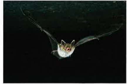
Zwervende Bechsteins vleermuis.

De Bechsteins vleermuis ( Myotis bechsteini ) is een middelgrote vleermuissoort die tot 21 jaar oud kan worden (Baagøe, 2011). De soort is een typische bosbewoner en stelt hoge eisen aan haar biotoop. Uit archeologische vondsten blijkt dat de Bechsteins vleermuis tot ongeveer 1 000 jaar geleden één van de algemeenste soorten was in onze streken (Lefevre en Verkem, 2003). Momenteel is de soort in heel Europa zeldzaam en sterk bedreigd, wat geleid heeft tot opname in de bijlage