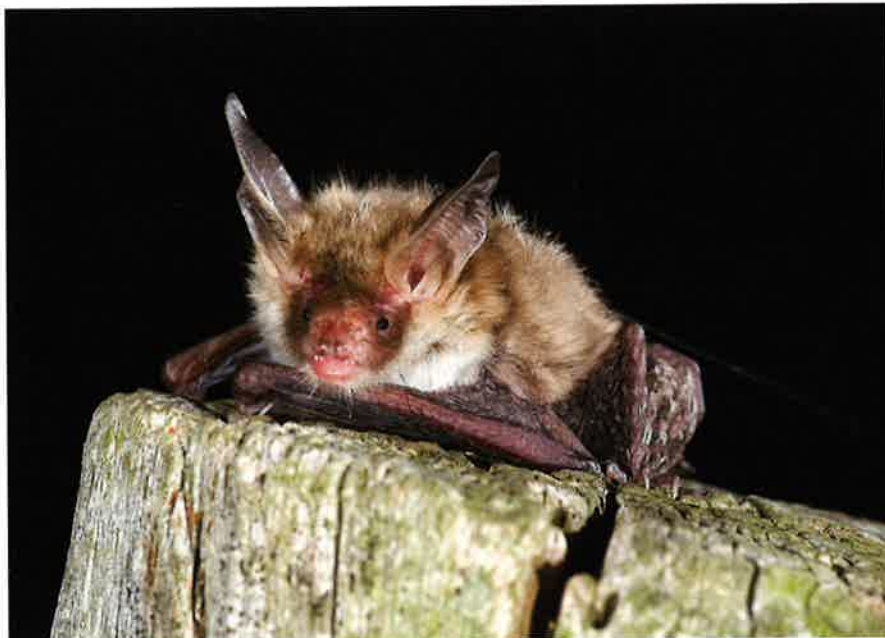
Bechsteins vleermuis.

In Wallonië wordt de Bechsteins vleermuis op diverse plaatsen in kleine aantallen overwinterend waargenomen (Lamotte, 2007). De meeste waarnemingen liggen ten zuiden van de rivieren de Samber en de Maas. In de Waalse kalksteengroeves van de St. Pietersberg (Lanaye) worden kleine aantallen gevonden tijdens de jaarlijkse wintertellingen, aansluitend bij de waarnemingen in Vlaanderen en Nederland. Ten zuiden van de Samber en de Maas wordt de soort in de zomer regelmatig gevonden bij mistnetonderzoek (mondelinge mededeling P. Nyssen; Dekeukeleire en Regelink, 2010). In het oosten van Nederland (Overijssel en Gelderland) zijn er sporadische winterwaarnemingen (1-3 individuen) en enkele zomerwaarnemingen. Enkel in Nederlands-Limburg wordt de soort de laatste tien jaar jaarlijks gevonden bij wintertellingen. Opvallend is dat bijna alle overwintelaars gevonden worden in de groeves ten westen van de Maas (dus vlak bij de Vlaamse grens). Bijzonder hierbij is, dat de