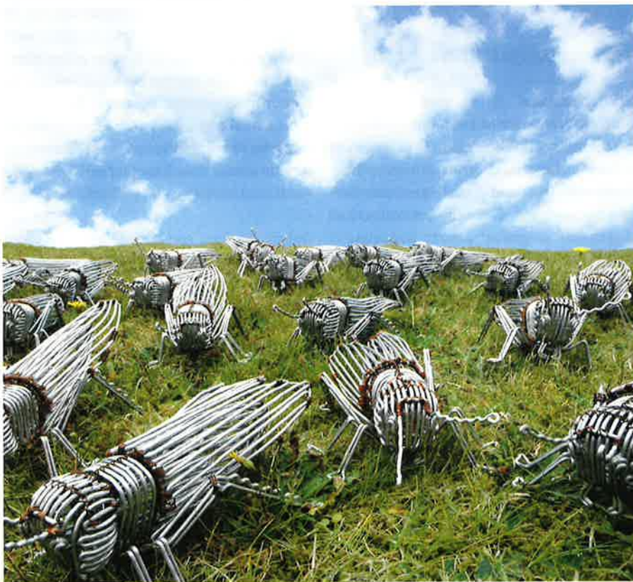
Figuur 1. Aan het project werd een internationaal tintje gegeven via een samenwerking met de Kisangani. Ambachtslui uit Congo ontwierpen een heus 'ijzeren Wekkertje' dat in Houthalen-Helchteren te koop aangeboden wordt. De opbrengst van de verkoop wordt gebruikt om het regenwoud in het Congobekken te behouden.

Wat het wegbermbeheer betreft, kan gesteld worden dat er nog steeds te weinig wegbermen zijn in de gemeente die ecologisch beheerd kunnen worden. Veel bermen zijn te smal, zijn beschaduwd of door niet-beheer verbost. Groot knelpunt is dat er rond de eigendommen van de bermen onduidelijkheid