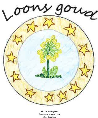
Figuur 1. Winnaar logowedstrijd provinciale MINA-raad.

De uitbreiding van het areaal van de Sleutelbloem is niet evident. Veel van de geschikte gronden zijn privé-eigendom. De eigenaars van deze gronden moeten dus geïnformeerd worden over de maatregelen die ze kunnen nemen in functie van het behoud en de uitbreiding van deze soort en over de financiële ondersteuning die ze hiervoor kunnen krijgen. De aanmaak van de folder, zoals hierboven vermeld, is een eerste aanzet, maar zal zeker